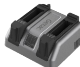
バッテリー充電器※

※ 充電器はバッテリー単体の充電用です。本体搭載のバッテリーは、ACアダプタ接続で充電が可能にて、本充電器は、本体利用中のスペアバッテリー充電などで、必要となるものです。