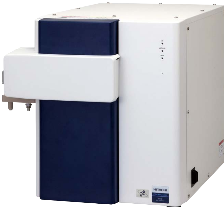
Chromaster® 5610質量検出器 (MS Detector)

※Chromasterは株式会社日立ハイテクノロジーズの日本およびその他の国における登録商標です。