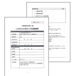
例) 標準試験手順書