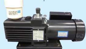
ロータリーポンプ*3