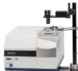
Real View DSC