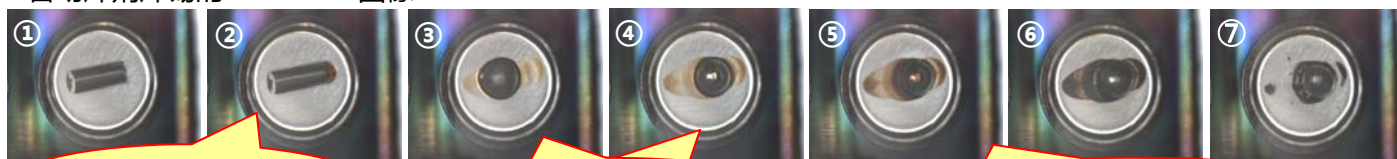
含助焊剂焊锡的Real View 图像

通常被大家认知的焊锡中的助焊剂，使焊锡的熔融温度降低。在较低温度变为液体，覆盖焊锡的表面，促进焊锡的润湿性，并且具有防止氧化的功能。 含助焊剂的焊锡，在DTA上可观察到焊锡熔融的吸热峰（180°C附近），在TG上可以确认因助焊剂热分解而质量减小（150~500°C）。 在Real View图像里，在熔融前的较低温度处可以看到助焊剂流出（②）。另外，因流动的助焊剂湿润性变高，可以确认熔融后的焊锡变形为水滴状态（④）。