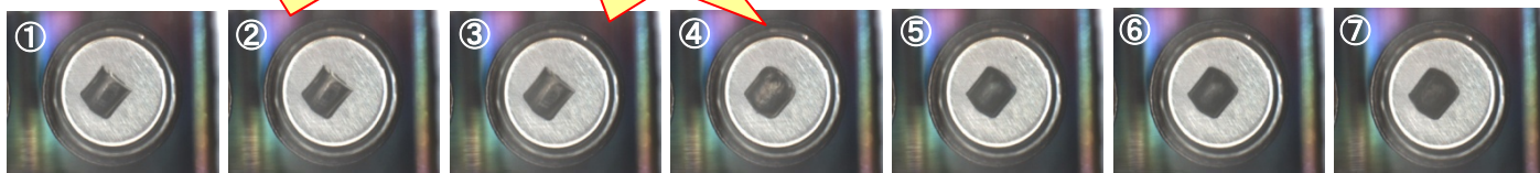
无助焊剂焊锡的Real View 图像