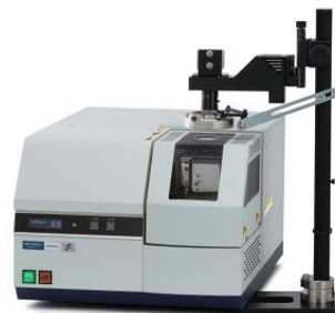
光学观察功能对应 热重-差热同步热分析仪 STA7200RV + RV-2TG