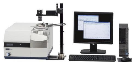
光学观察选配项 DSC7000X + RV-1D