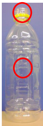
从塑料瓶的瓶身部位以及瓶口部位（透明）采样。