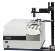
Real View DSC