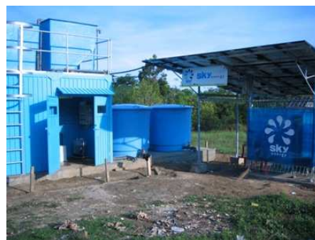
太陽光発電システム（右）を組み合わせた浄水装置（左）