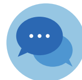
グループチャット