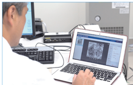
画像にコメントを付加