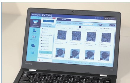
高画質画像も一括共有