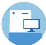
装置状況のモニタリング