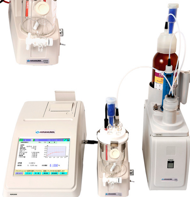
自動水分測定装置AQV-2200A