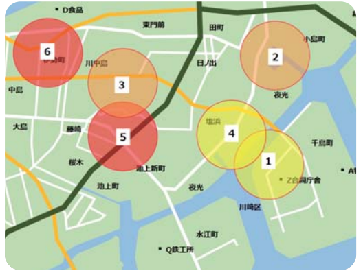
落雷情報地図プロット例

落雷が起きた地点を地図上にプロットしたり、落雷が発生した時刻、発生位置の北緯・東経、雷多重度をリスト表示させたりすることができます。また、過去1年間の落雷件数をグラフにして、お客様に提供するサービスも行っています。